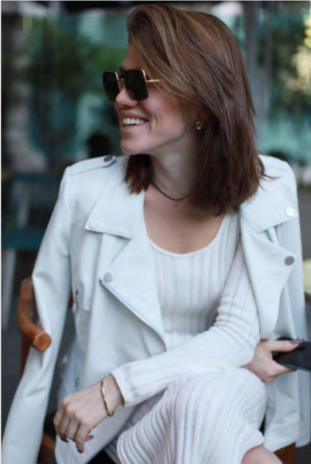
Классическая косуха в белой коже