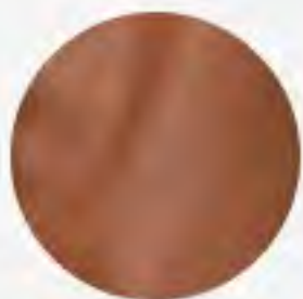
Rapide (AG) Indian tan