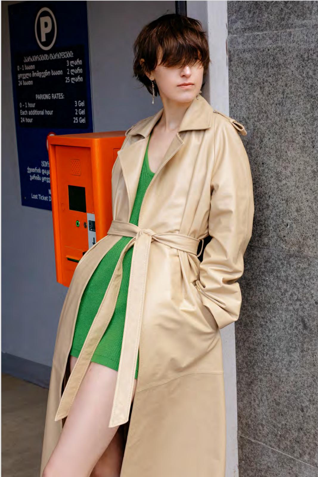
Тренч кожаный из гладкой кожи