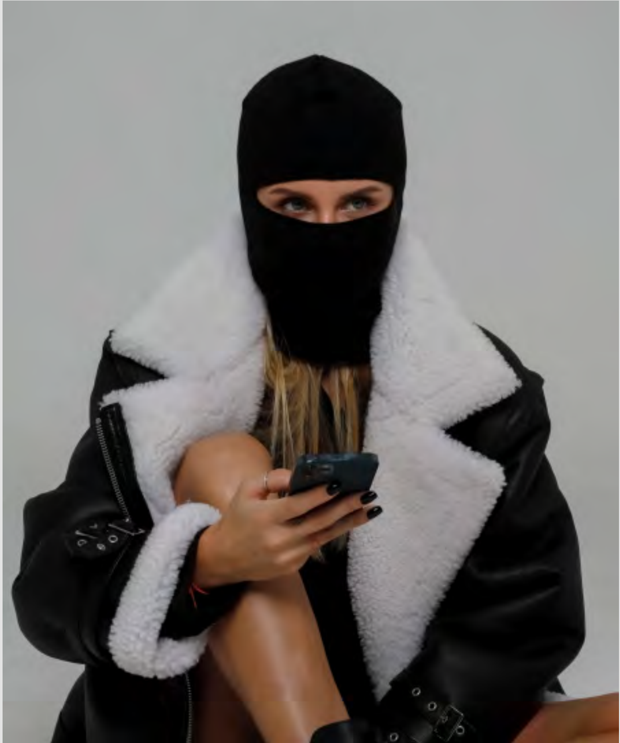
Дубленка "OVERSIZE" черная с мехом