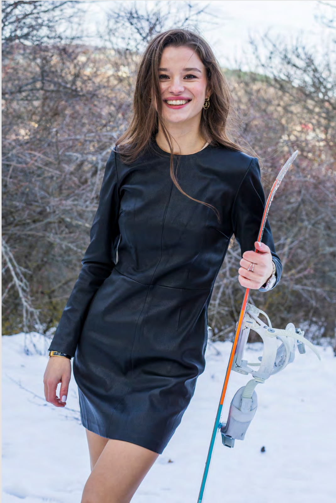
Платье с рукавами кожаное по фигуре