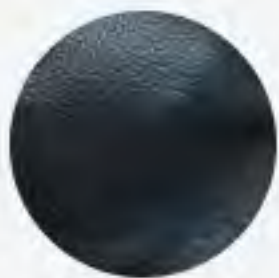
Фактурная кожа Carra Tip. Vaggi