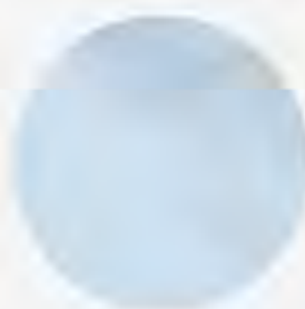
Фактурная белая Rapide (AG)