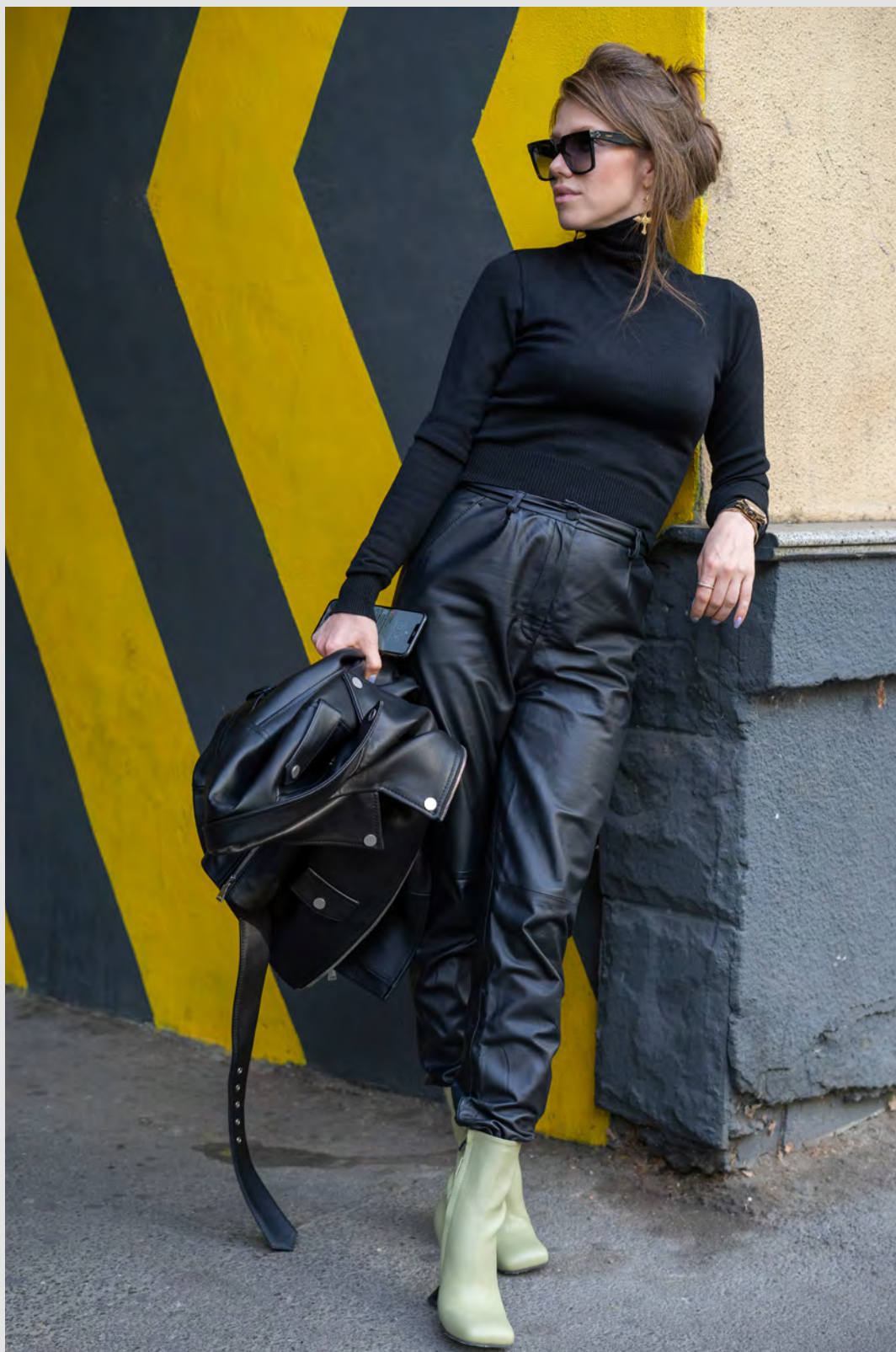
Брюки из кожи с полированной изнанкой