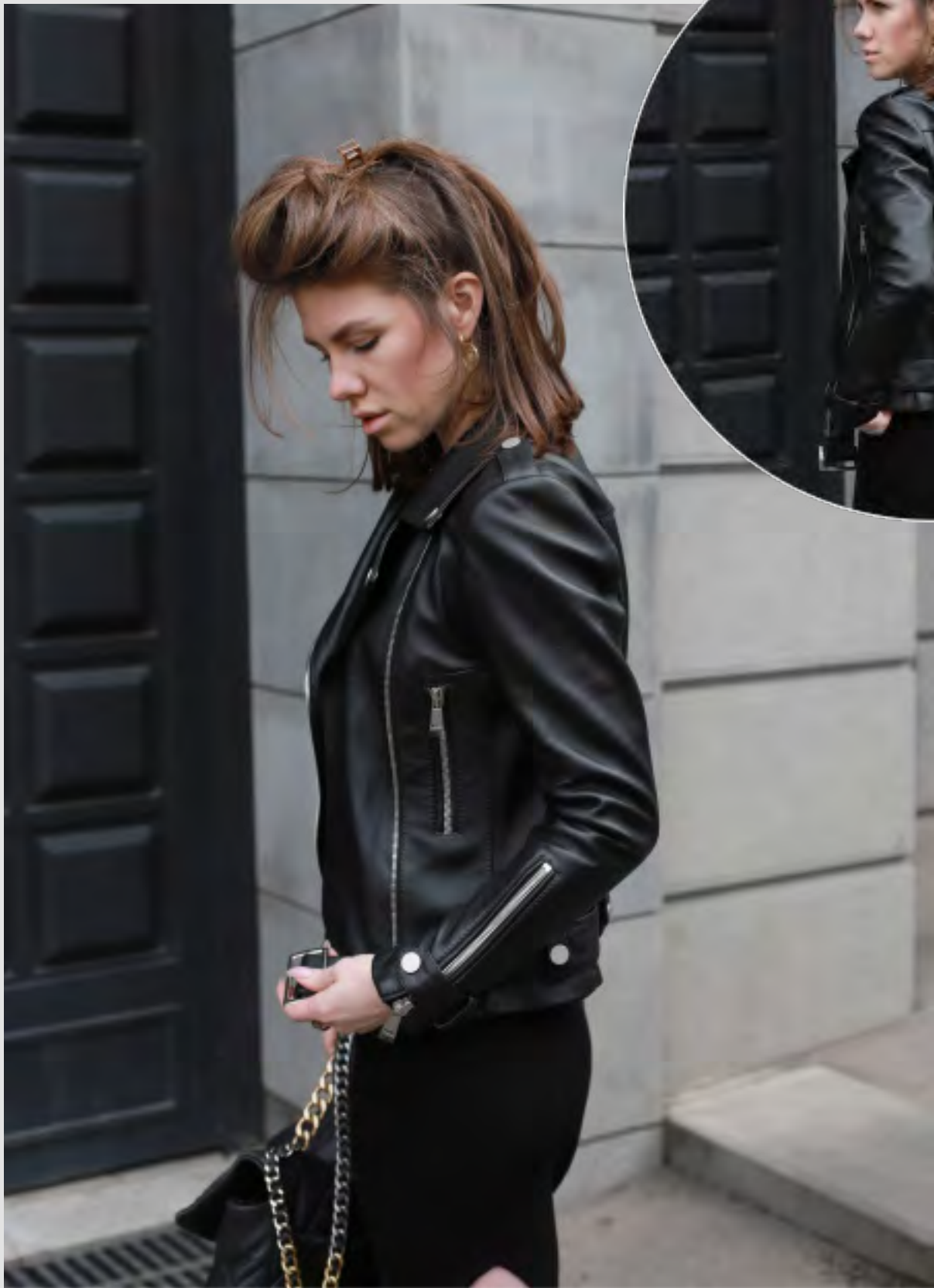
Классическая кожаная куртка из натуральной гладкой кожи