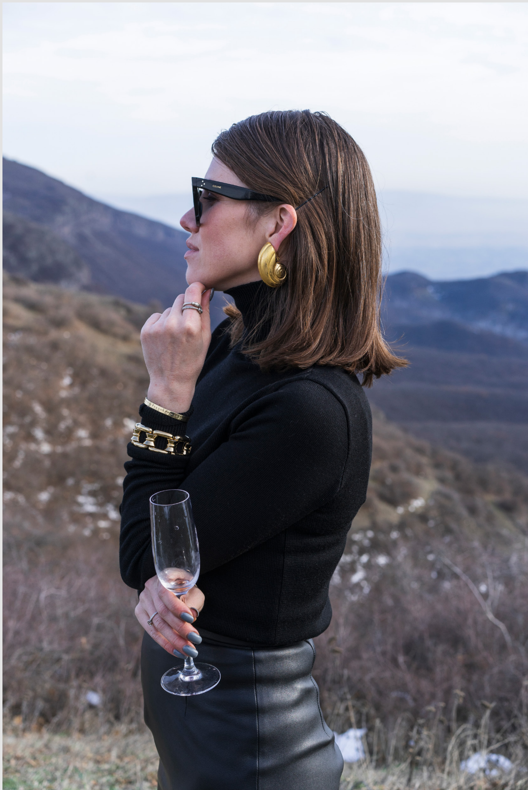
Роллинг (водолазка) классический