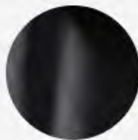
Плотная кожа Atlantic black